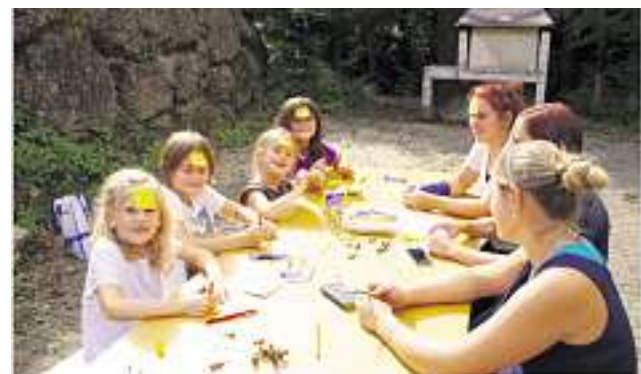
Besuche auch du unsere Schnupperhocks am Samstag, 12. und 26. September sowie 10. Oktober. Wir freuen uns auf dich!