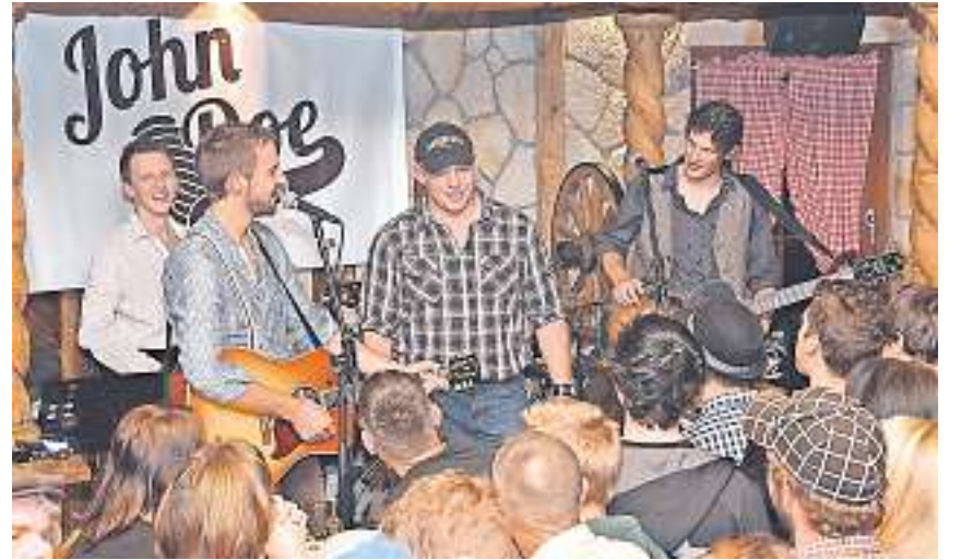
Die John Doe Band anlässlich des Konzertes vom letzten Jahr in der Horseshoe Event Bar in Oberarth mit Gastgeber Martin Annen.