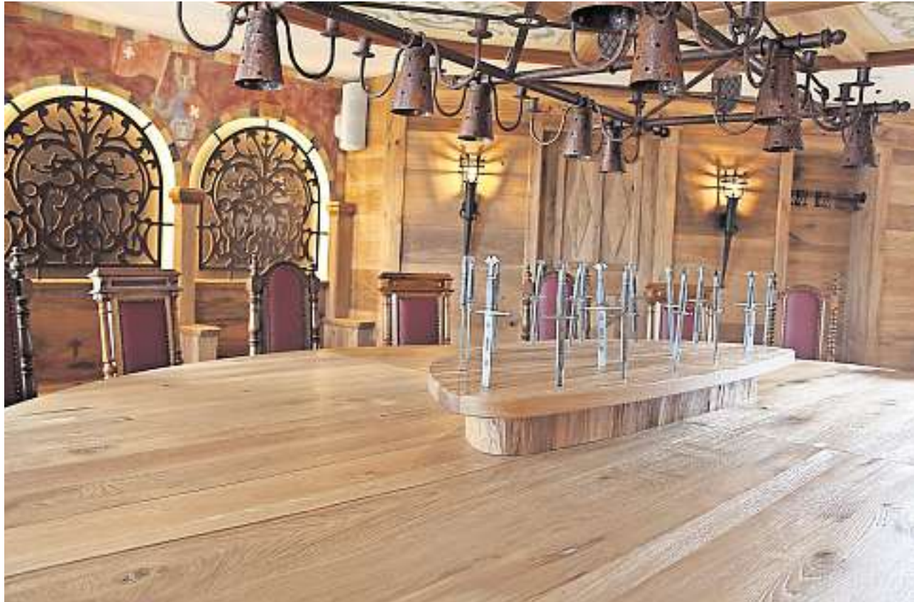
In der gediegenen Ritter Stube lässt es sich ganz besonders schöne Feste feiern.